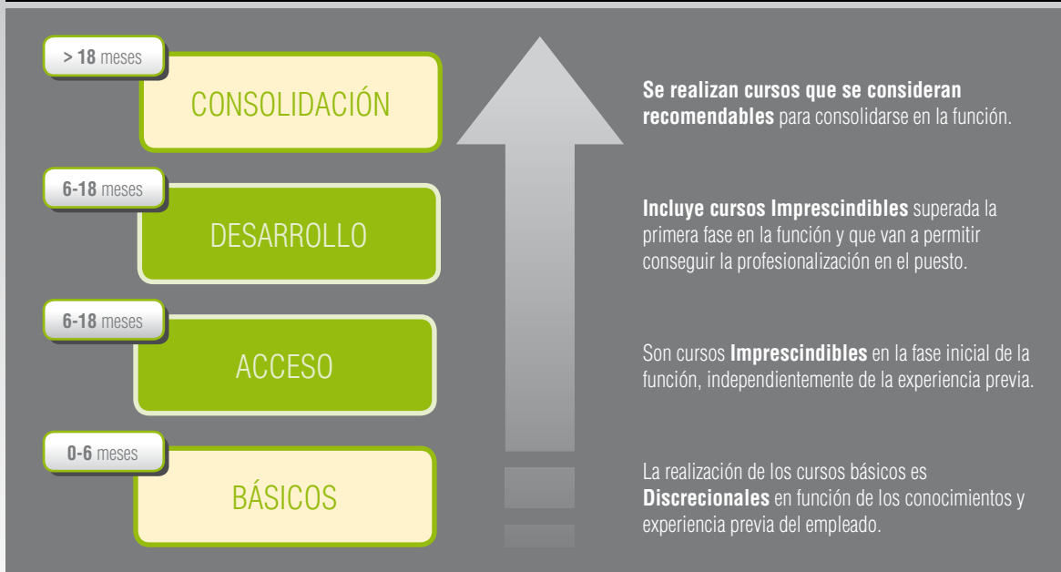
CUADRO 2. ETAPAS DEL PROGRAMA LAUDE